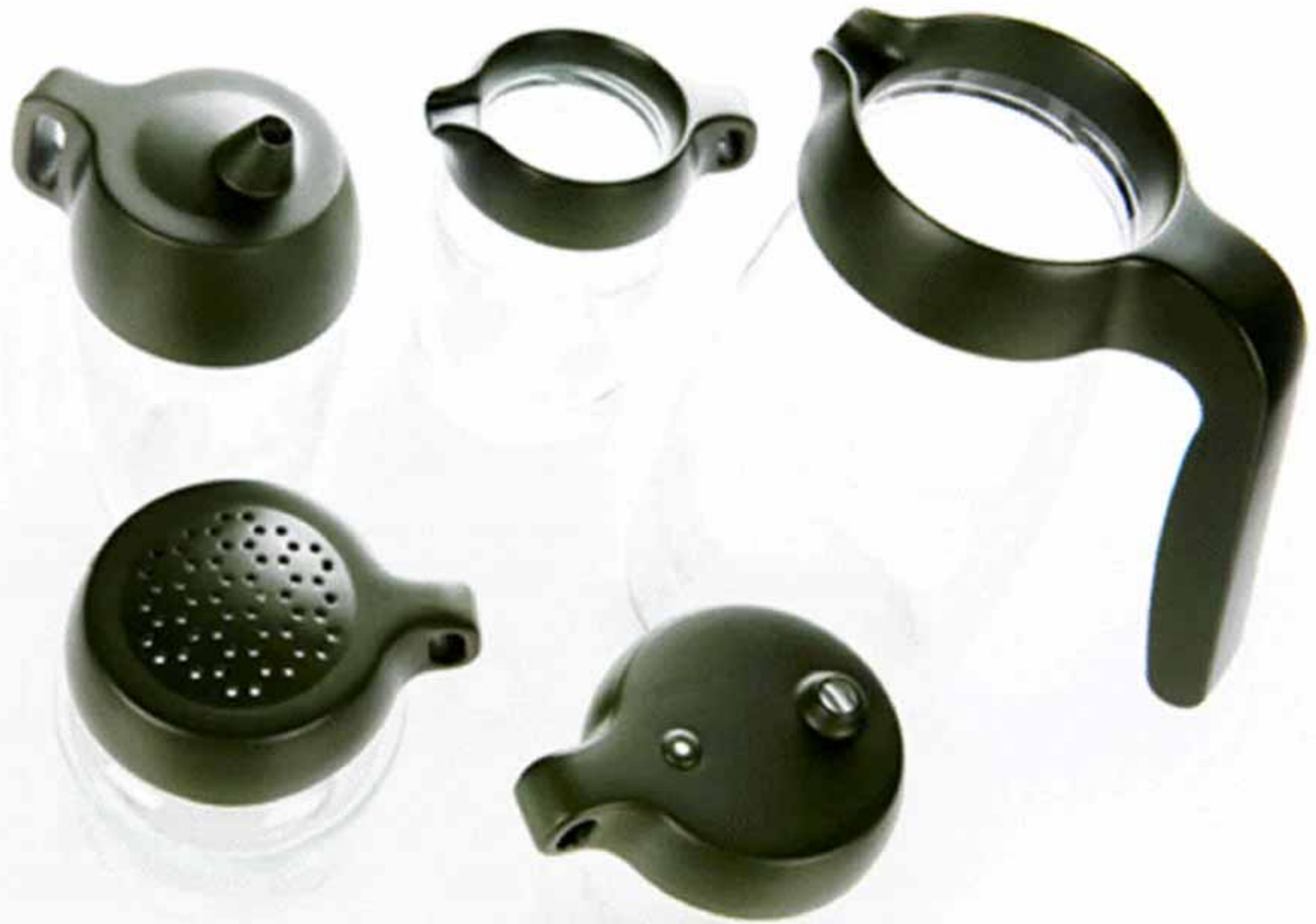
Pre-cycle, Jar tops, Royal VKB