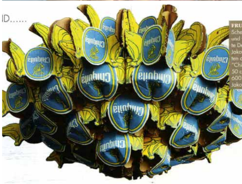
Re-use / Up cycle